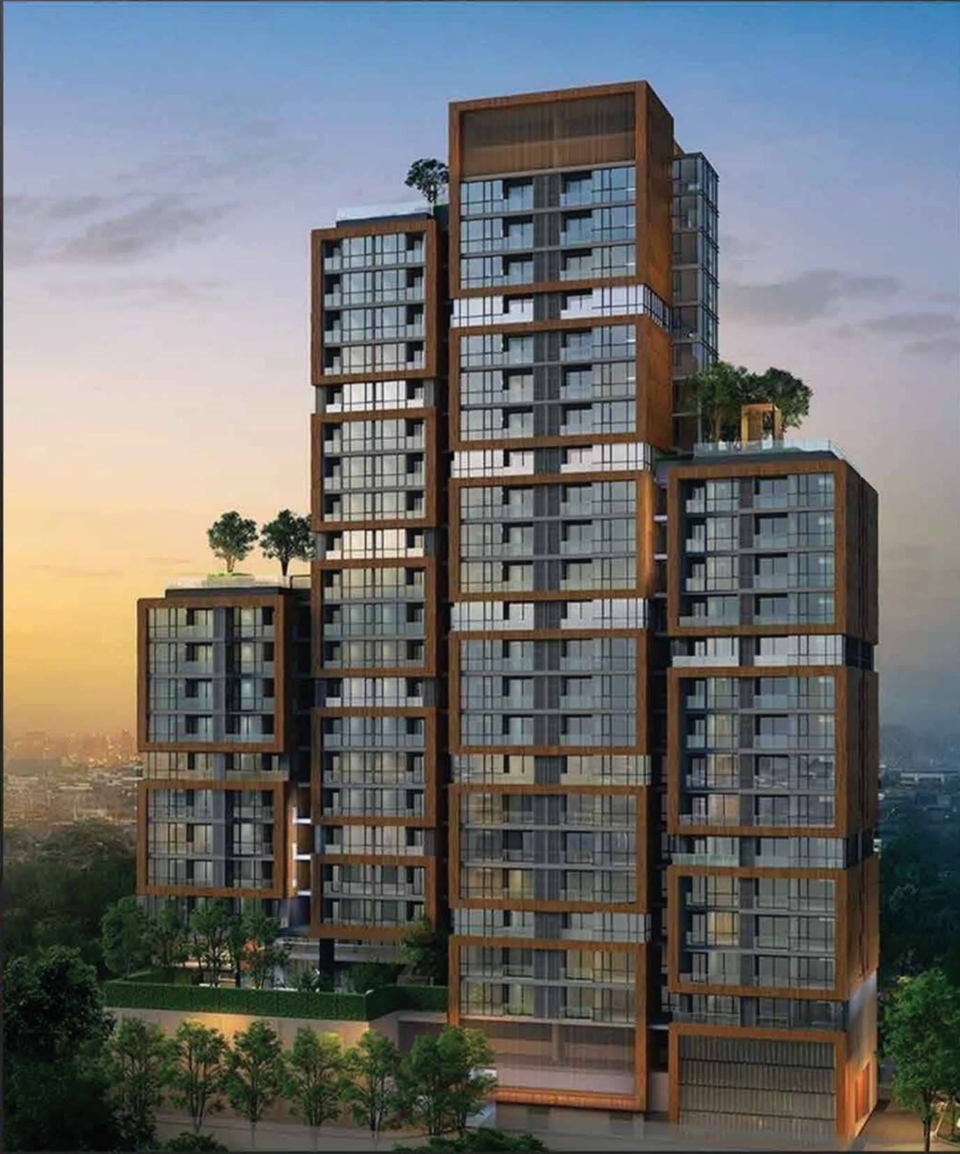
PROJECT : THE ROOM สุขุมวิท 38

📍 ตำแหน่งที่ตั้ง : สุขุมวิท 38 , กรุงเทพมหานคร