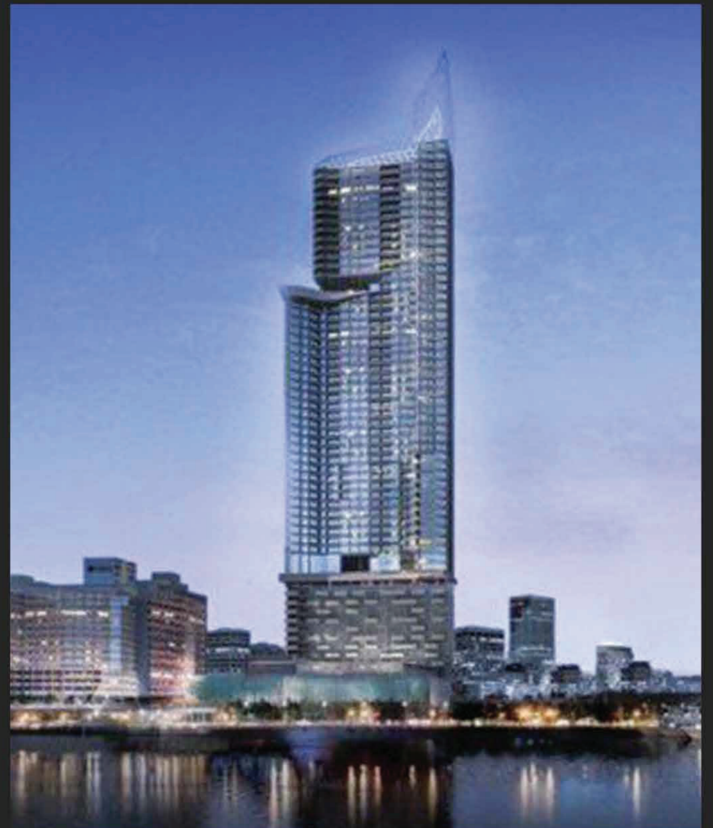
PROJECT : MENAM RESIDENCES

📍 ตำแหน่งที่ตั้ง : ถ.เจริญกรุง , กรุงเทพมหานคร