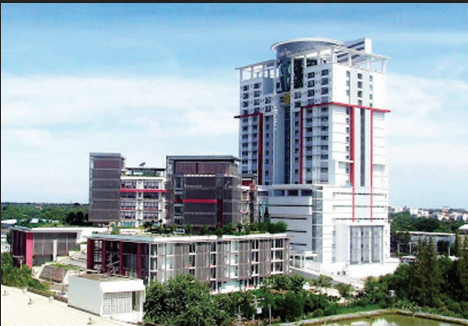
PROJECT : โรงพยาบาลชลประทาน