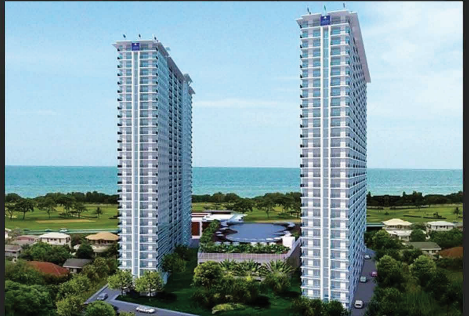
PROJECT : AD GRAND JOMTIEN PATTAYA

📍 ตำแหน่งที่ตั้ง : สุขุมวิท 38 , กรุงเทพมหานคร