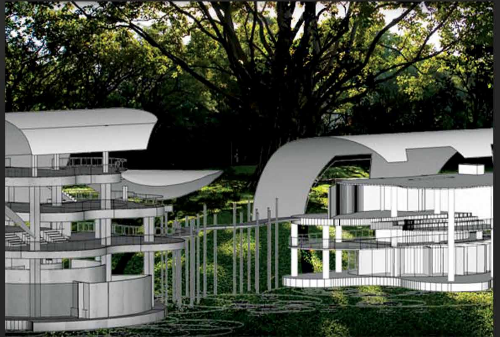
PROJECT : อาคารสาวิทาสีกวลัย เสถียรธรรมสถาน

📍 ตำแหน่งที่ตั้ง : งามวงศ์วาน , กรุงเทพมหานคร