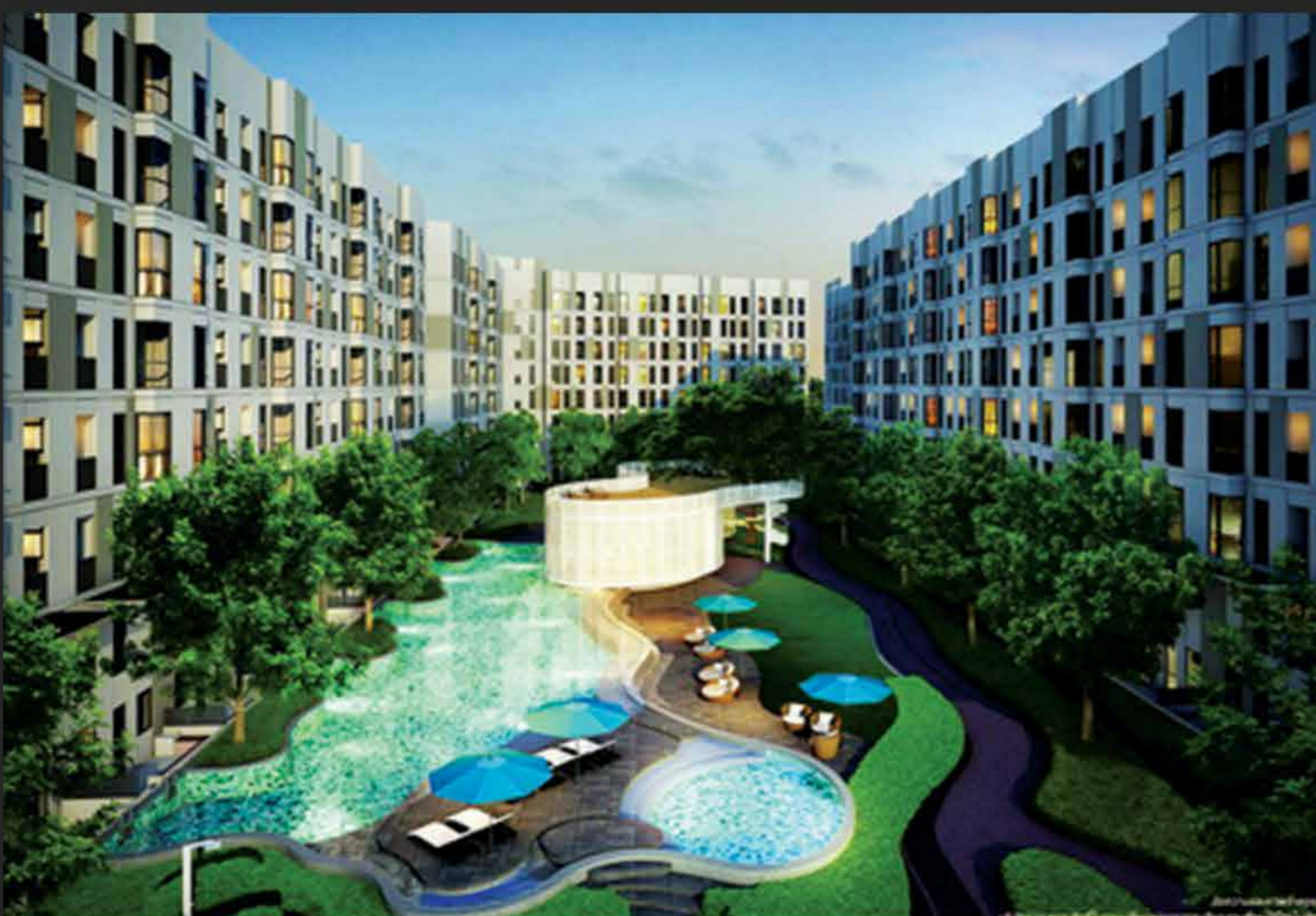
PROJECT : UNIO สุขุมวิท 72

📍 ตำแหน่งที่ตั้ง : บางเขน , กรุงเทพมหานคร